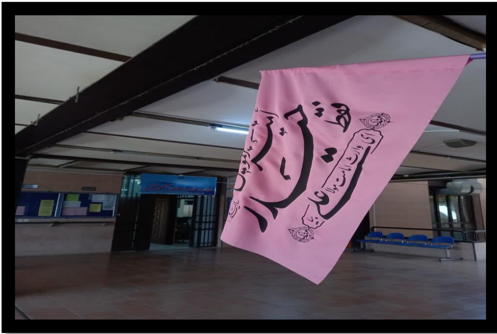
۹- نصب پرچم های عزای حضرت اباعبدالله در دانشکده