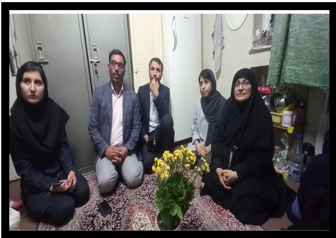
۷- بزرگداشت جشن عید غدیر با اهدا هدایا بین همکاران و دانشجویان